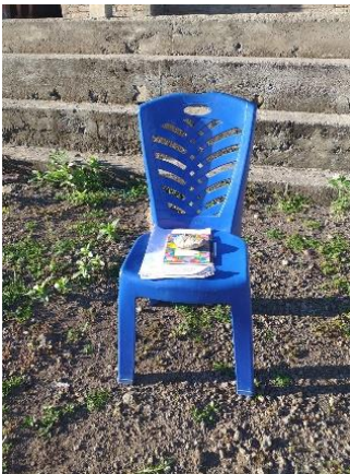
Gambar: Kursi yang digunakan untuk tempat pengumpulan tugas.

Saat memberikan bimbingan belajar kepada para muridnya, Ibu Erna dan Ibu Rina juga memperhatikan prosedur pencegahan Covid-19. Keduanya sengaja memberitahukan para murid dan orang tua murid untuk menyediakan kursi atau meja kecil di depan rumah untuk meletakkan tugas belajar yang diberikan atau yang akan dikumpulkan oleh kedua guru ini. Mereka juga membatasi diri untuk tidak masuk sampai ke dalam rumah siswa. Biasanya pemberian dan pengumpulan