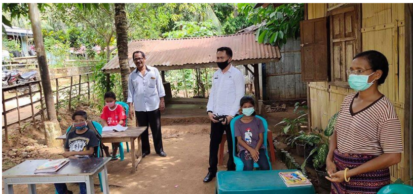
Pemantauan pelaksanaan kegiatan belajar dari rumah oleh Kepala Dinas PKO Kab. Sikka