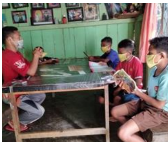
Gambar: Pendampingan belajar lurina dalam kelompok kecil

S DI Lento terletak di Desa Pocoranaka Timur, Kabupaten Manggarai Timur, Nusa Tenggara Timur. Semenjak kegiatan belajar mengajar dilakukan di rumah, kepala sekolah memberikan beberapa arahan yang dapat mendukung KBM tetap berjalan. Kepala sekolah memanfaatkan forum di Whatsapp (WA group) untuk mempermudah koordinasi antara kepala sekolah dengan para guru. Untuk mempromosikan kesehatan dan juga sebagai upaya pencegahan Covid-19, sekolah melakukan pembagian masker dan sekaligus sosialisasi CTPS (cuci tangan pakai sabun) kepada anak-anak yang sudah dibagi ke dalam beberapa kelompok siswa berdasarkan lokasi tempat tinggal.