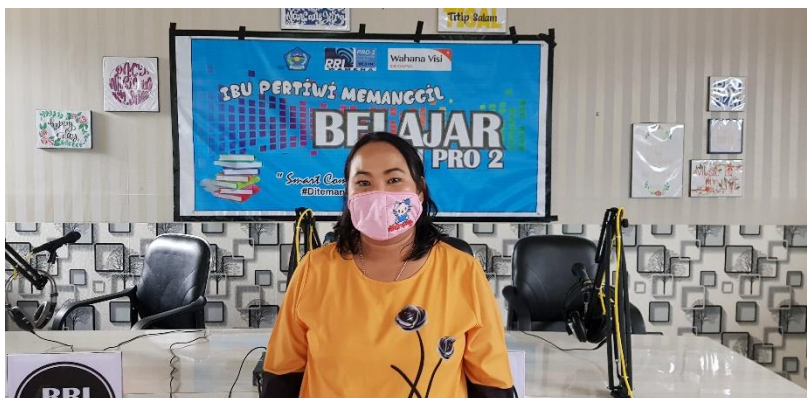
Ibu Vriska di Ruang Siaran RRI Wamena

T erima kasih kepada Wahana Visi Indonesia, Dinas Pendidikan Kabupaten Jayawijaya dan RRI Wamena yang sudah menginisiasi program belajar lewat Radio. Ini merupakan satu terobosan baru kepada kami selaku guru untuk terus memenuhi hak anak dalam bidang pendidikan di masa Covid-19 ini. Ini adalah pengalaman saya yang pertama kali mengajar lewat RRI, awalnya saya merasa grogi, dan takut. Namun Puji Tuhan hari ini semuanya berjalan dengan baik.